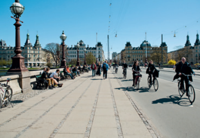
Radschnellweg in Kopenhagen