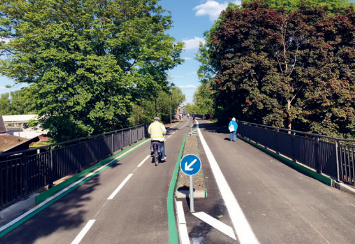
Radschnellweg in Nordrhein-Westfalen